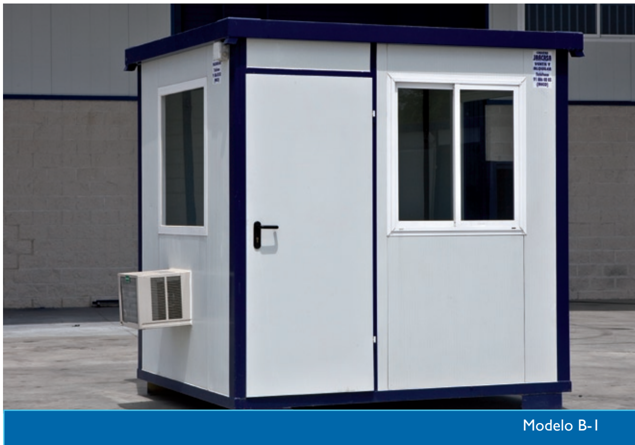
Modelo B- I